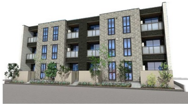
※ 当図はイメージです。実際とは異なる場合があります。