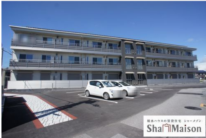
積水ハウスの賃貸住宅 シャーメゾン Sha Maison