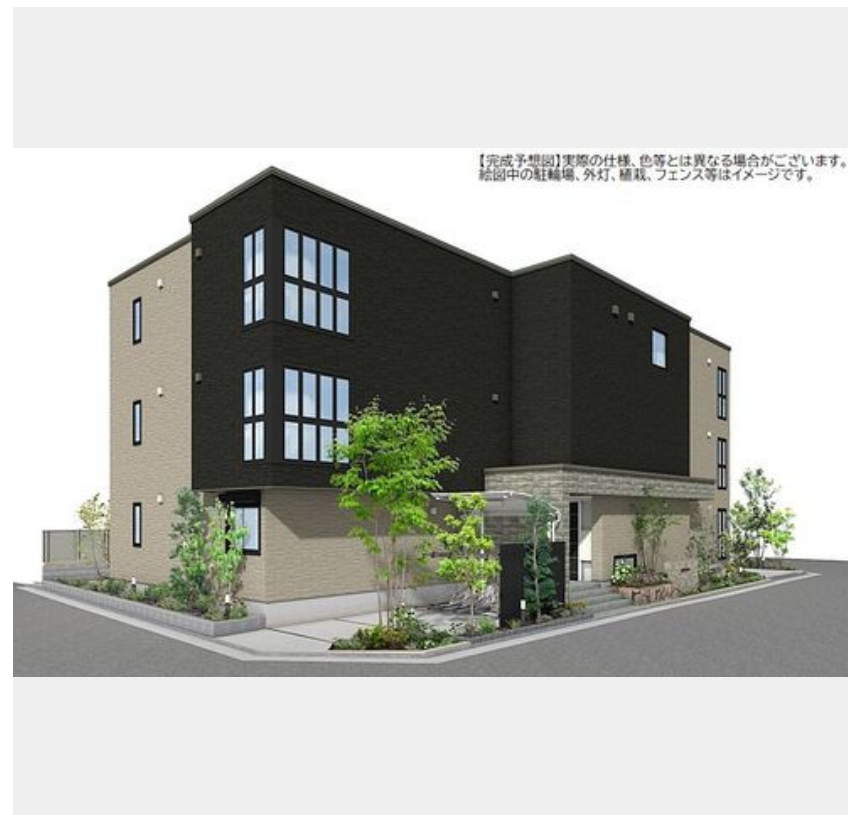
【完成予想図】実際の仕様、色等とは異なる場合がございます。絵图中的の駐輪場、外灯、植栽、フェンス等はイメージです。