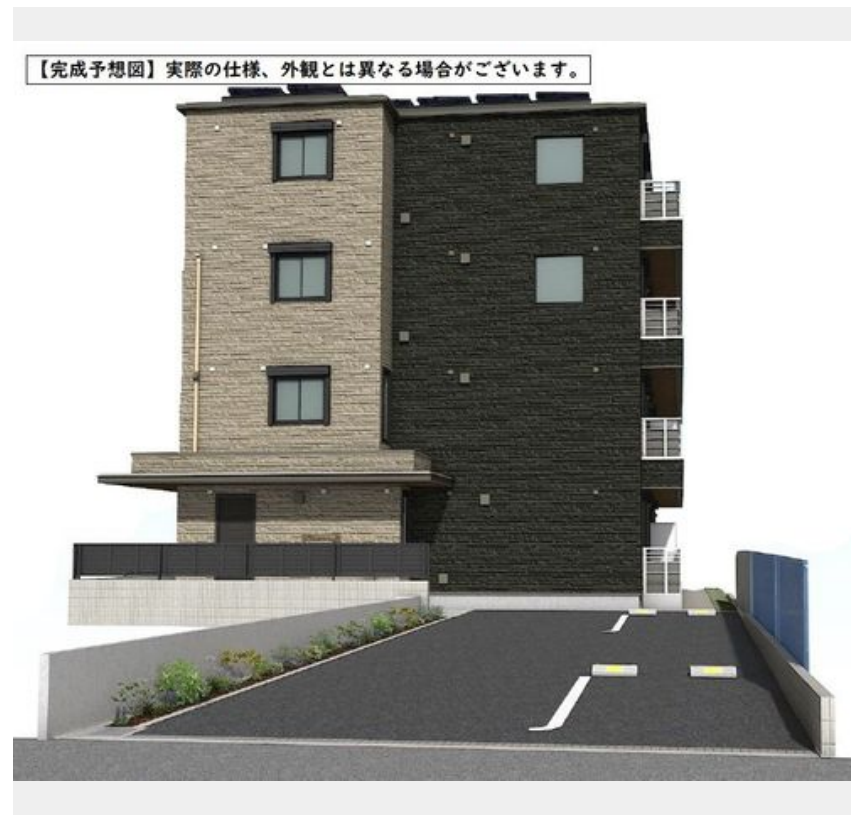
【完成予想図】実際の仕様、外観とは異なる場合がございます。