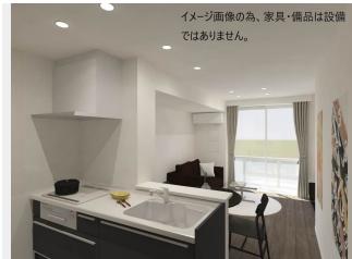
イメージ画像の為、家具・備品は設備 ではありません。