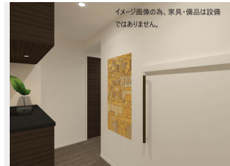
イメージ画像の為、家具・備品は設備 ではありません。