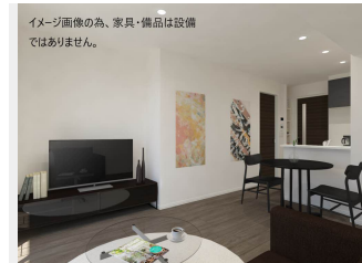
イメージ画像の為、家具・備品は設備 ではありません。