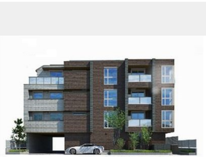
※イメージ画像のため実際と異なる場合がございます。