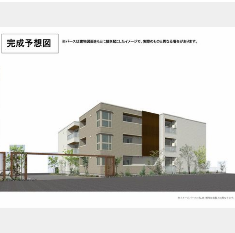
完成予想図 ※パースは建物図面をもとに描き起こしたイメージで、実際のものとは異なる場合があります。