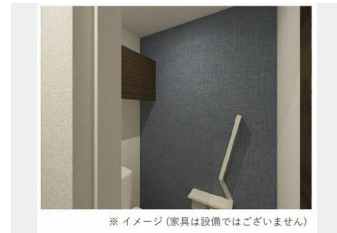
※ イメージ (家具は設備ではございません)