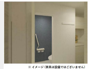
※ イメージ (家具は設備ではございません)