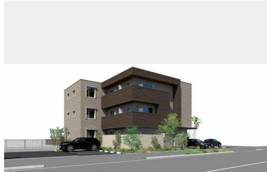
※写真は完成予想図です パースは実際の図面をもとに描き起こしたイメージで、実際のものとは異なる場合があります