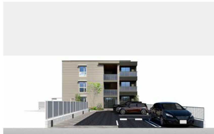
※写真は完成予想図です パースは実際の図面をもとに描き起こしたイメージで、実際のものとは異なる場合があります