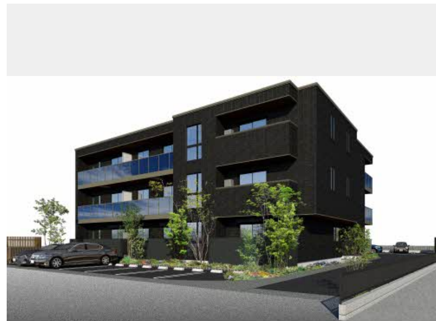
※写真は完成予想図です パースは実際の図面をもとに描き起こしたイメージで、実際のものとは異なる場合があります