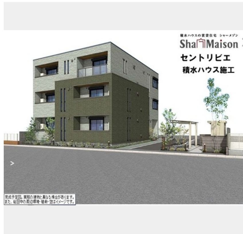
積水ハウスの賃貸住宅 シャーメゾン Sha Maison セントリビエ 積水ハウス施工