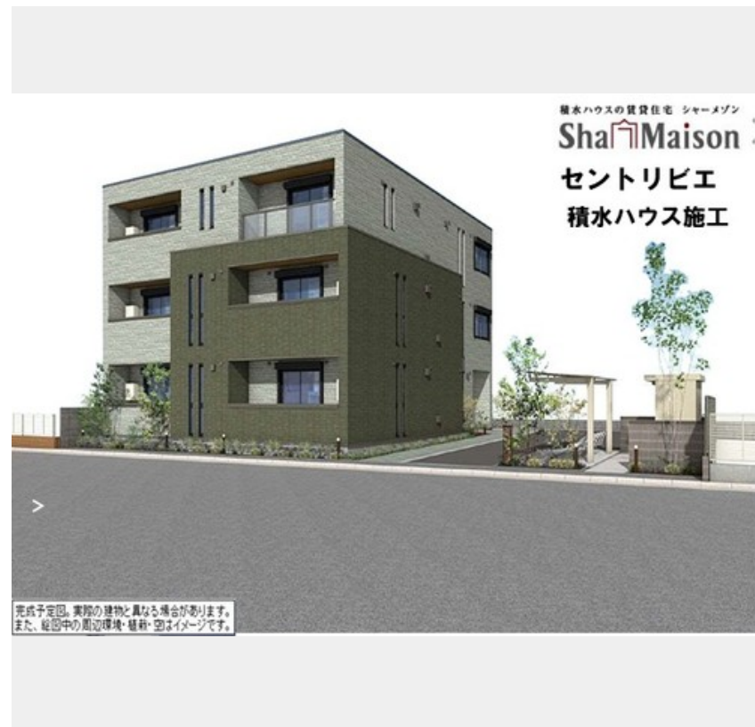
積水ハウスの賃貸住宅 シャーメゾン Sha Maison セントリビエ 積水ハウス施工