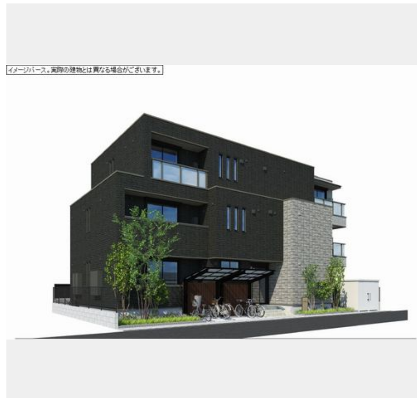
イメージバース。実際の建物とは異なる場合がございます。