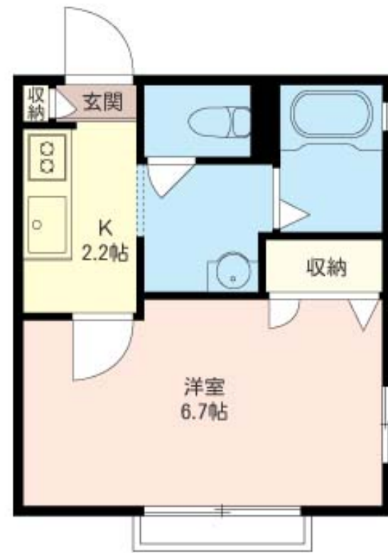
積水ハウスの賃貸住宅 シャーメゾン