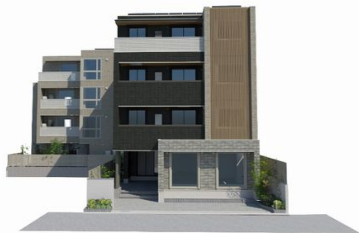
イメージ画像のため実物と異なる場合があります。