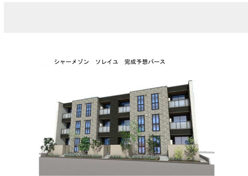
シャーメゾン ソレイユ 完成予想パース