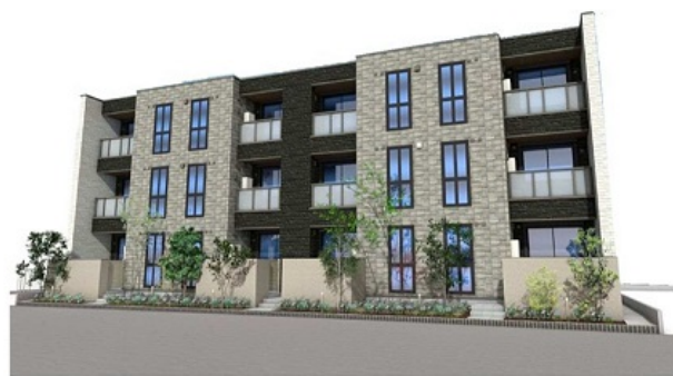
シャーメゾン ソレイユ 完成予想パース