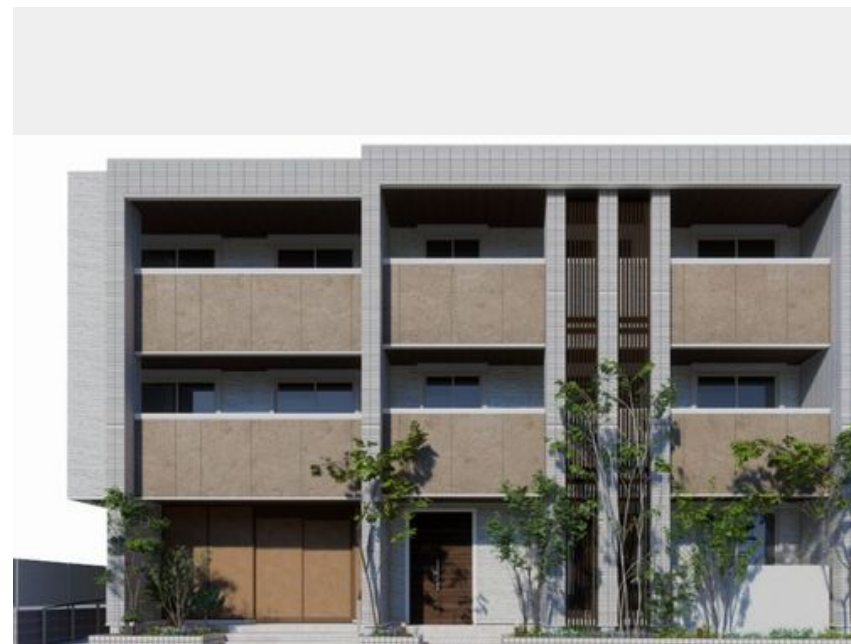
※こちらはハース図となり、イメージとなります。色や仕様、質感等異なる場合がございます。