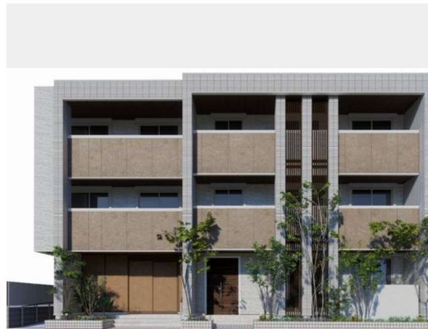
※こちらはハース図となり、イメージとなります。色や仕様、質感等異なる場合がございます。