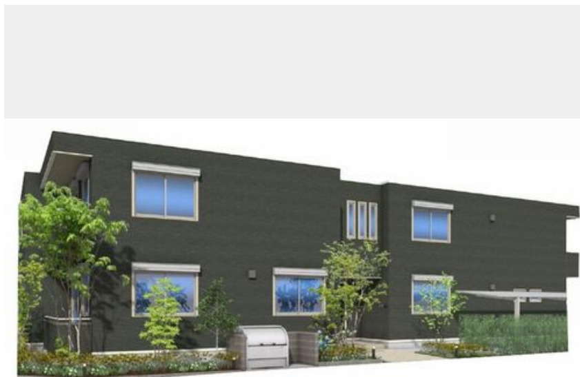
※こちらはパース図となり、イメージとなります。色や仕様、質感等異なる場合がございます。