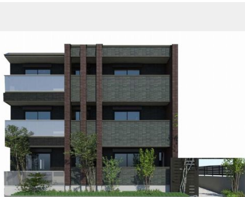
※こちらはパース図となり、イメージとなります。色や仕様、質感等異なる場合がございます。