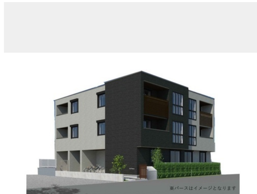
※パースはイメージとなります