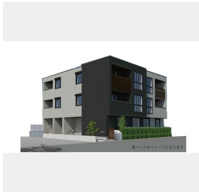
※パースはイメージとなります