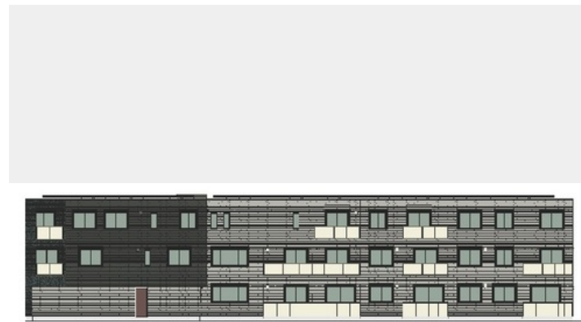
こちらはイメージです。実物とは色合いや質感が異なりますので、ご注意ください。