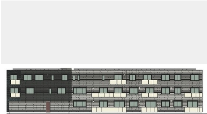
こちらはイメージです。実物とは色合いや質感が異なりますので、ご注意ください。