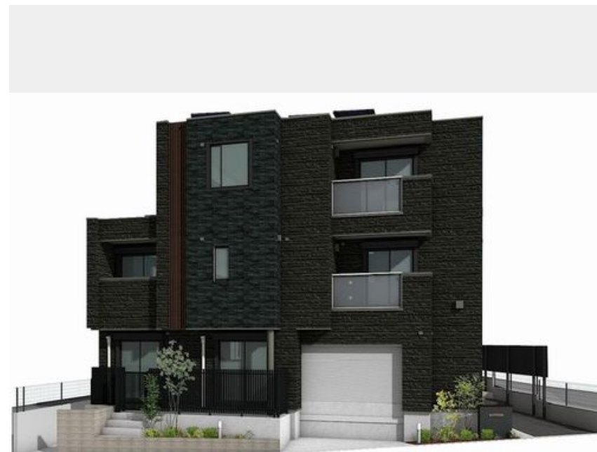
※こちらはパース図となり、イメージとなります。色や仕様、質感等異なる場合がございます。