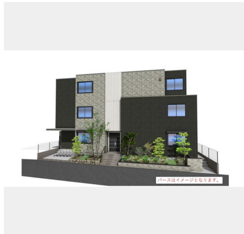
パースはイメージとなります。