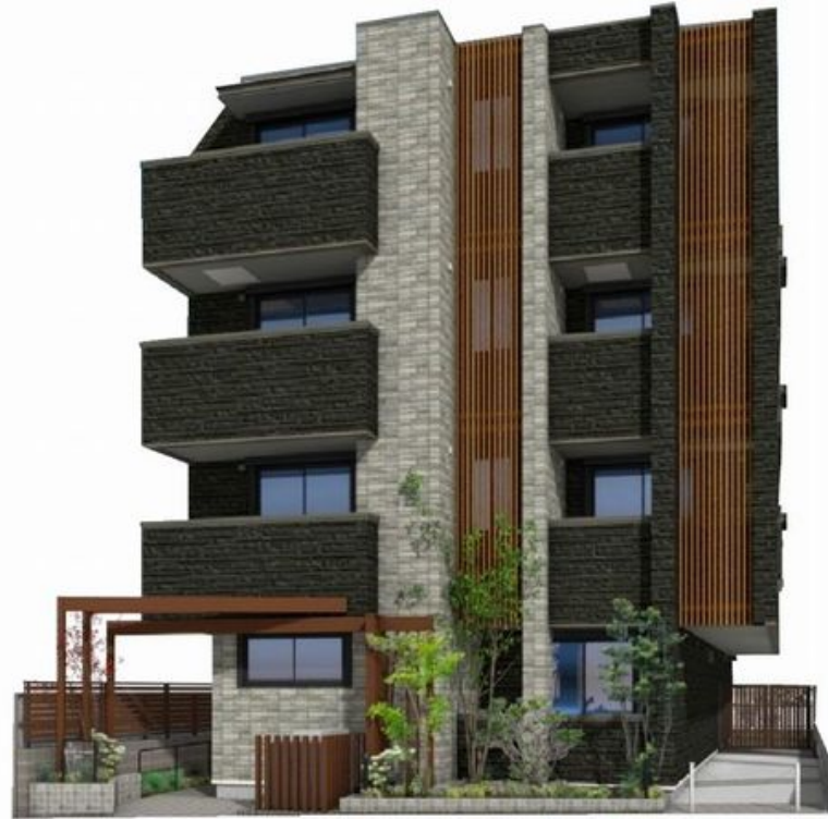
※こちらはパース図となり、イメージとなります。色や仕様、質感等異なる場合がございます。