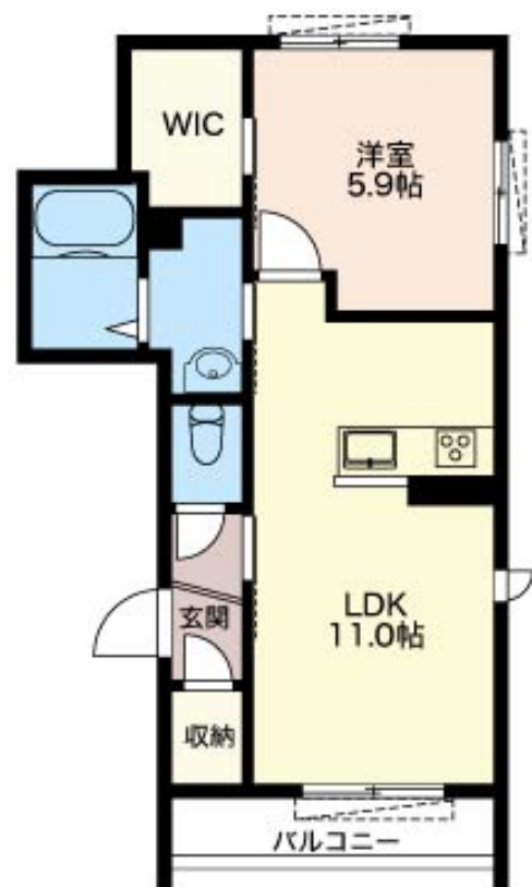
積水ハウスの賃貸住宅 シャーメゾン