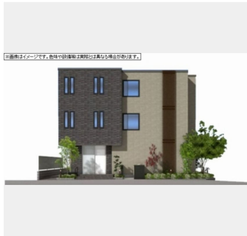
※画像はイメージです。色味や設備等は実際とは異なる場合があります。