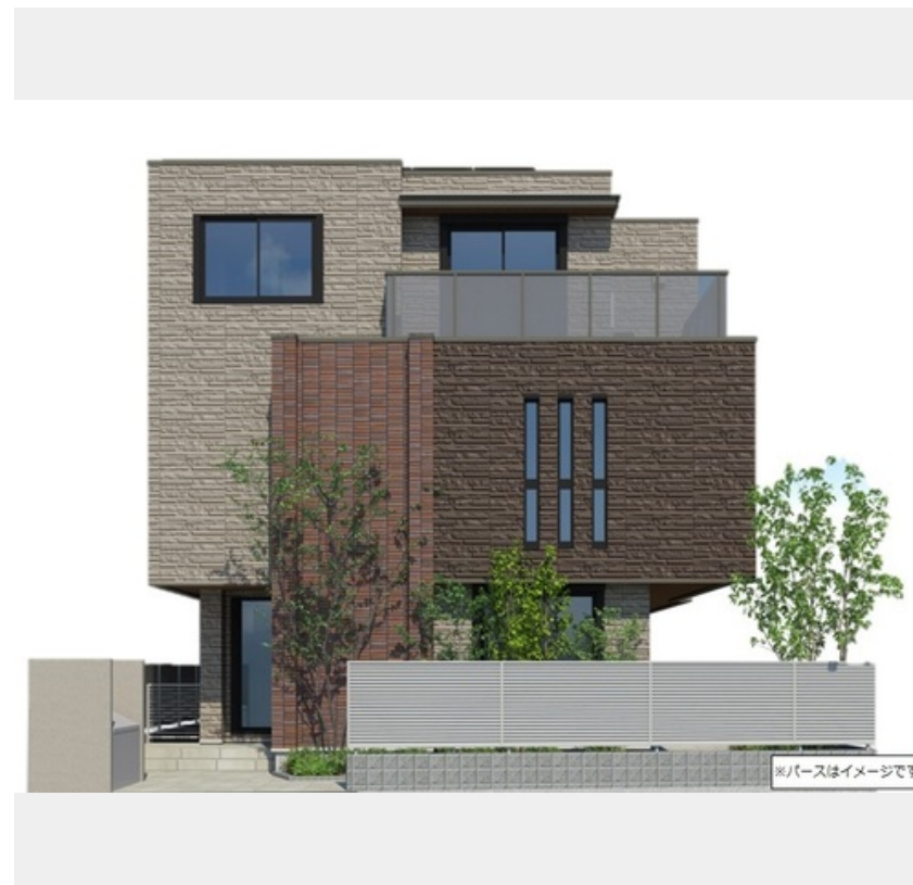
※パースはイメージです