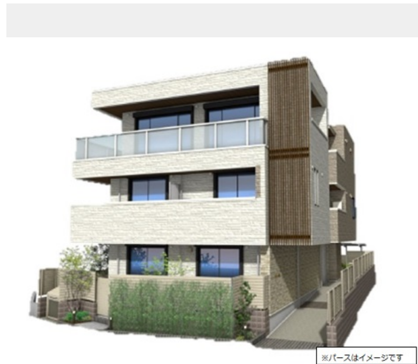
※パースはイメージです