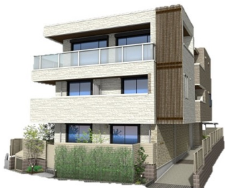
※パースはイメージです