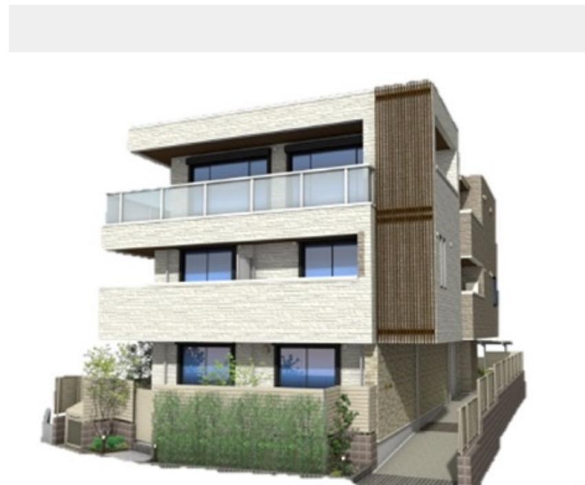
※パースはイメージです