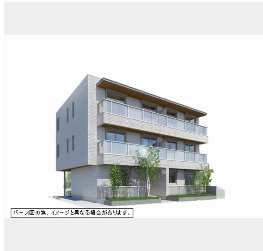
パース図の為、イメージと異なる場合があります。