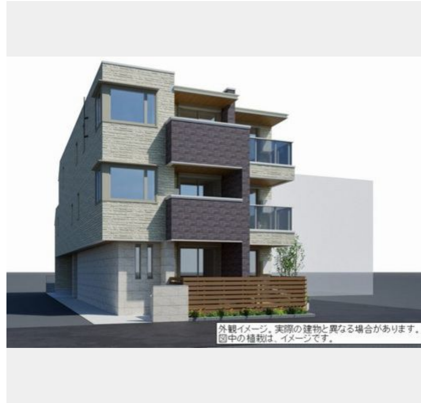
外観イメージ。実際の建物と異なる場合があります。図中の植栽は、イメージです。