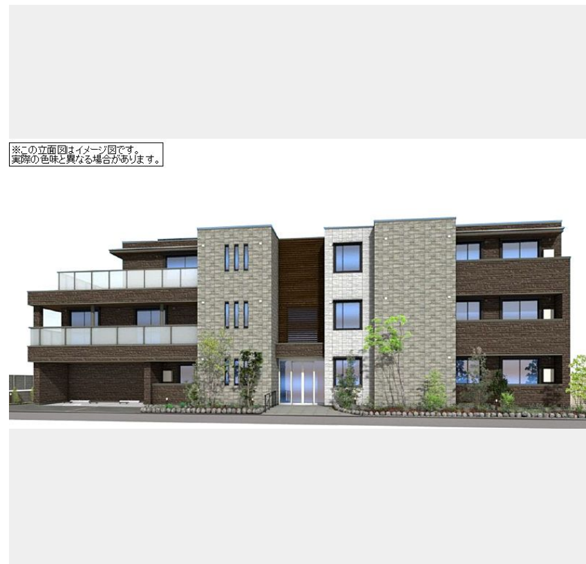
※この立面図はイメージ図です。実際の色味と異なる場合があります。