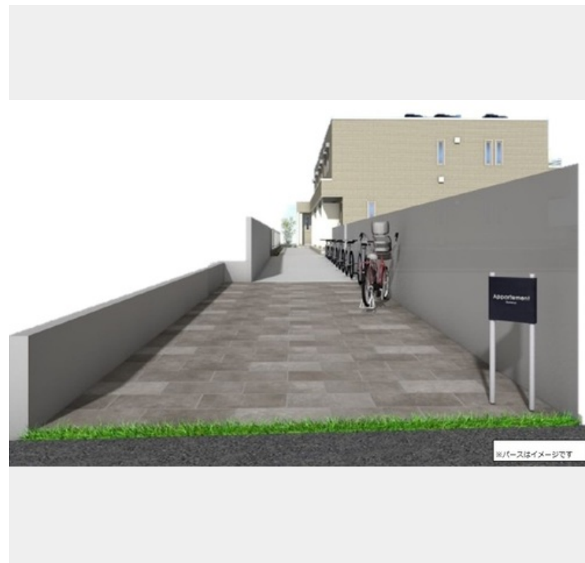
※パースはイメージです