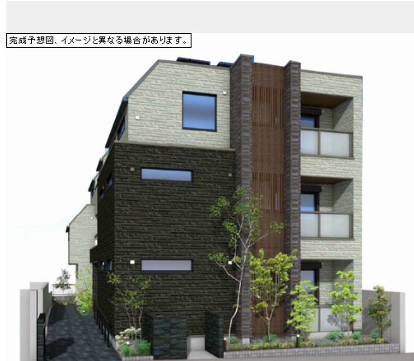
完成予想図、イメージと異なる場合があります。