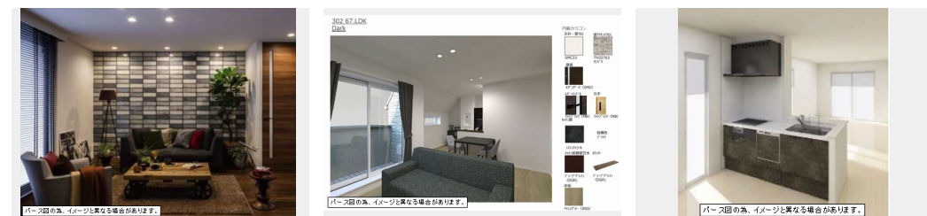
パース図のみ、イメージと異なる場合があります。