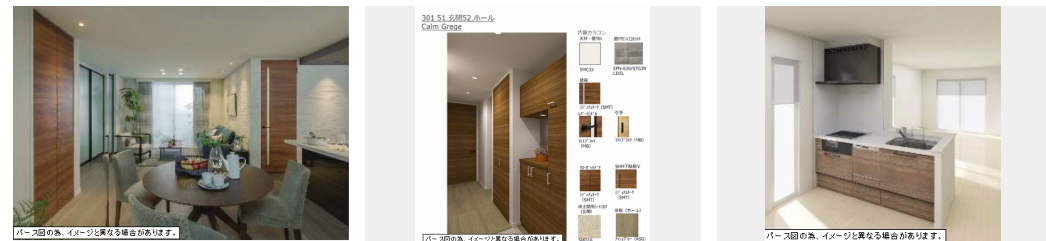
パース図のみ、イメージと異なる場合があります。