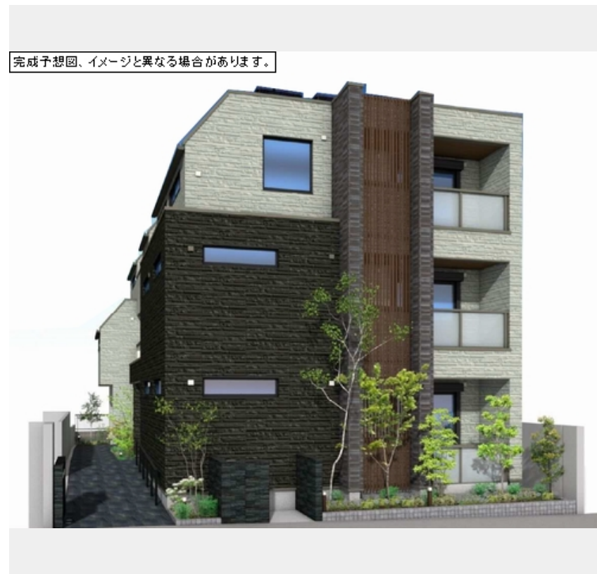
完成予想図、イメージと異なる場合があります。