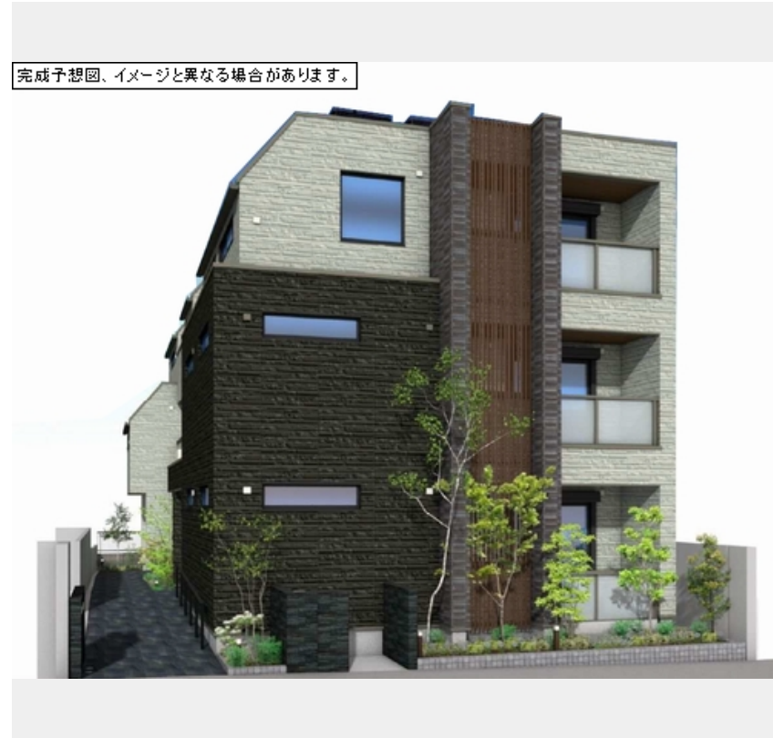
完成予想図、イメージと異なる場合があります。