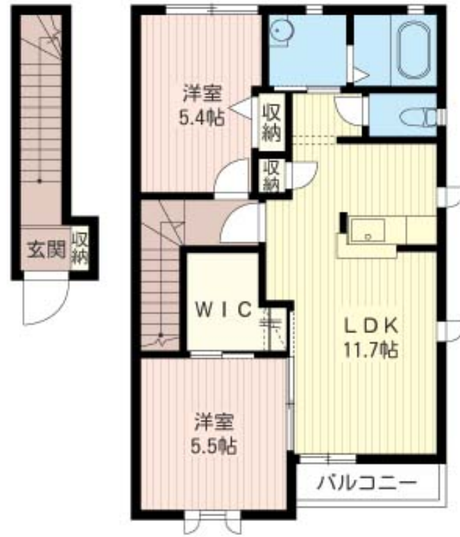
積水ハウスの賃貸住宅 シャーメゾン