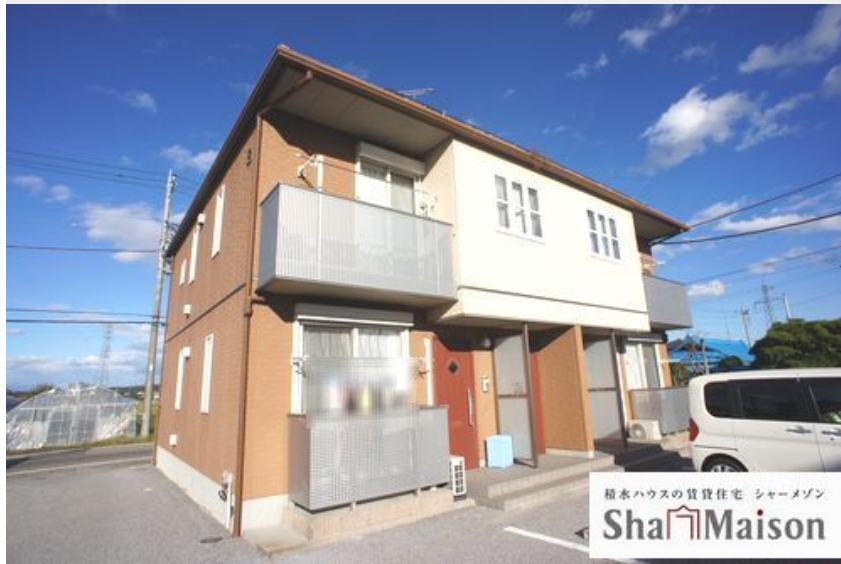
積水ハウスの賃貸住宅 シャーメゾン Sha Maison