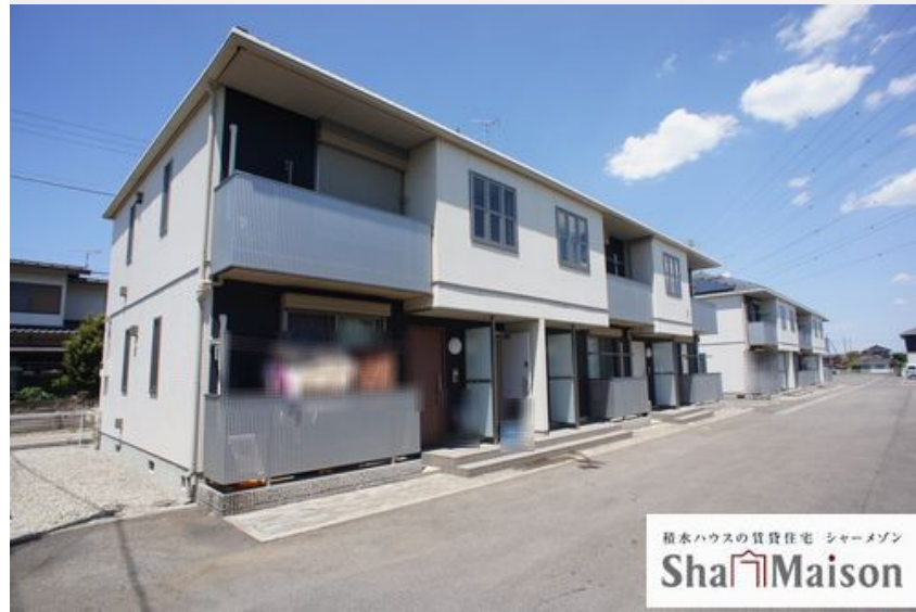
積水ハウスの賃貸住宅 シャーメゾン Sha Maison