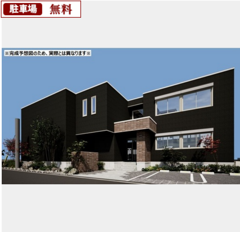
※完成予想図のため、実際とは異なります※