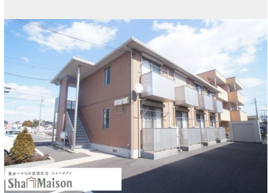
積水ハウスの賃貸住宅 シャーメゾン Sha Maison