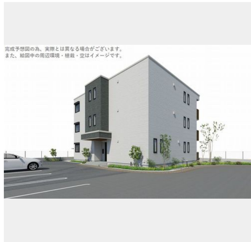
完成予想図の為、実際とは異なる場合がございます。 また、絵图中的の周辺環境・植栽・空はイメージです。