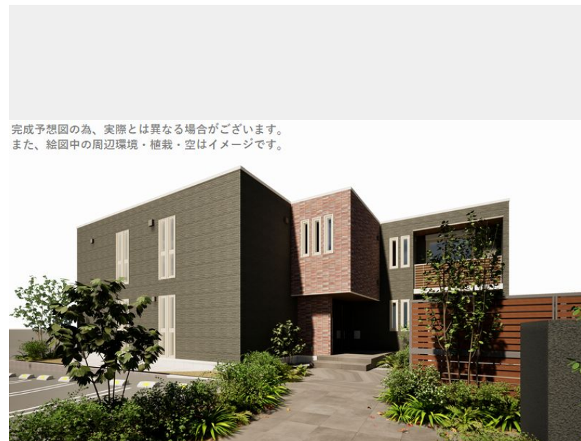
完成予想図の為、実際とは異なる場合がございます。また、絵図中の周辺環境・植栽・空はイメージです。