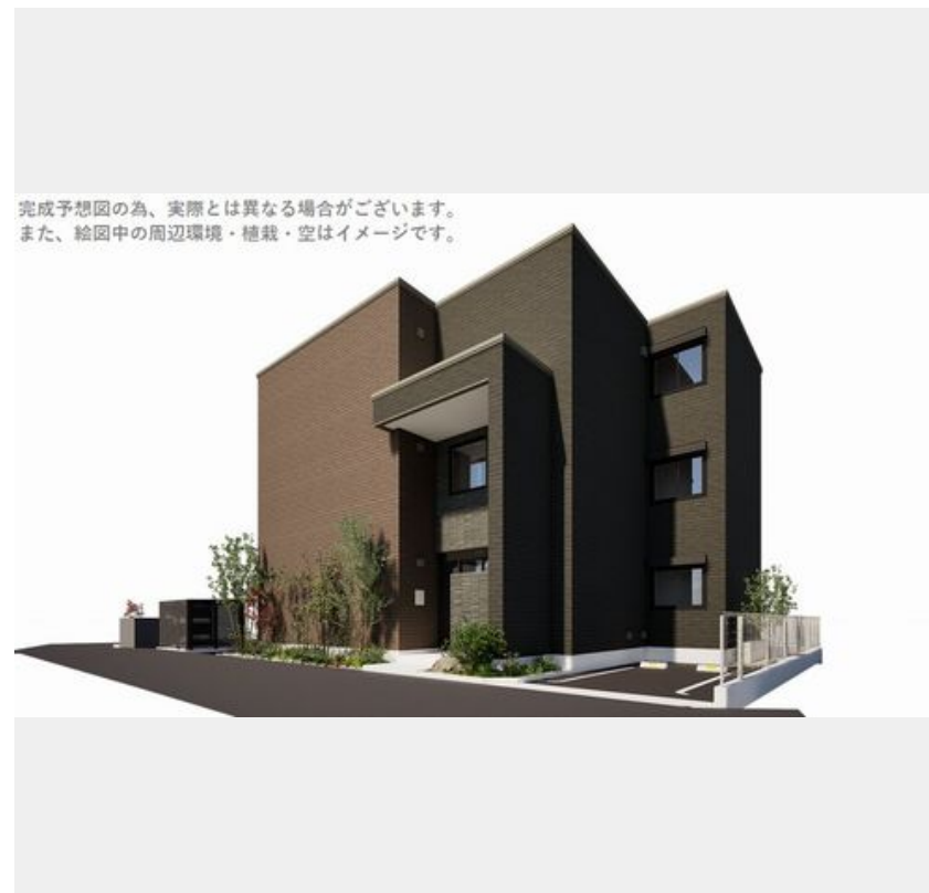
完成予想図の為、実際とは異なる場合がございます。また、絵图中的周辺環境・植栽・空はイメージです。